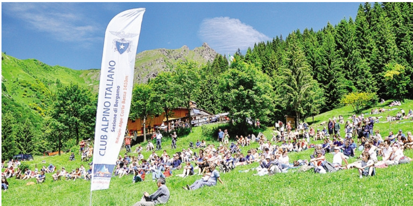
Un festoso incontro sui prati al rifugio Alpe Corte, tradizionale meta per famiglie e piccoli escursionisti