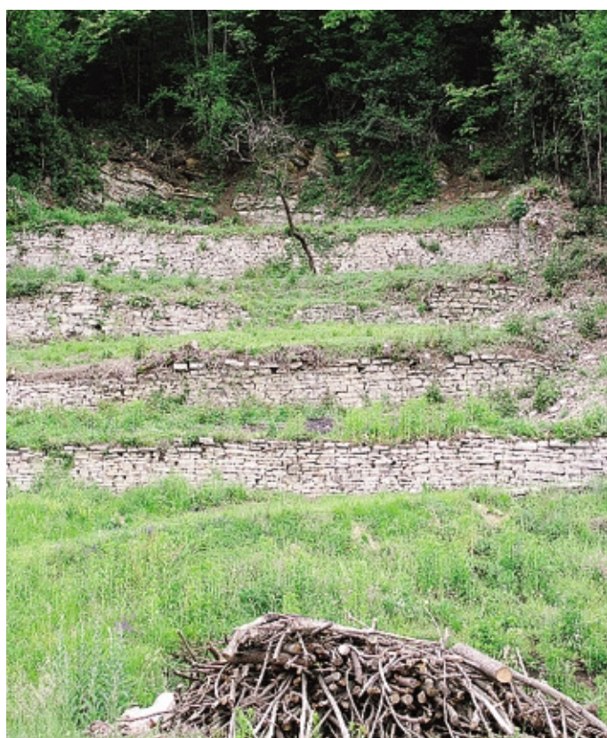
Terrazzamenti di antichi coltivi a Cà Berizzi, in Valle Imagna. Degradato e rovina accompagnano l'abbandono e il rinselvatichimento del luogo

Il tema sul quale paesaggisti e «pensatori» del verde si incontreranno all'Ostello Curò, situato accanto all'omonimo rifugio a 1.900 metri di quota, in Alta Valle Seriana, sarà l'importanza del «wild», il non coltivato, il «selvaggio» in città, sul territorio regionale, campagna compresa, e soprattutto sul «rinselvatichimento» che si sta verificando nelle vaste aree alpine. Al centro del dibattito in particolare l'abbandono delle aree agricole montane, l'avanzata del bosco, l'equilibrio tra l'esigenza di produrre e realizzare beni agroalimentari, offerte turistiche, infrastrutture e la necessità di tutelare le specie animale e vegetali soprattutto nelle Terre Alte. Senza trascurare il problema che questo