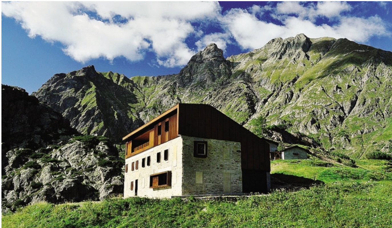
L'Ostello Curò, il più alto d'Europa, situato nei pressi dell'omonimo rifugio che ospiterà l'Alpine Seminar il 10 e 11 settembre

la giornata con pranzo e cena al rifugio. Il giorno dopo i partecipanti si trasferiranno, attraverso il passo di San Marco, nella Valle del Bitto di Albaredo con escursione didattica al rifugio Alpe Piazza e all'omonimo alpeggio; pranzo con prodotti di montagna nel rifugio stesso. Nella foto: il rifugio Madonna delle Nevi