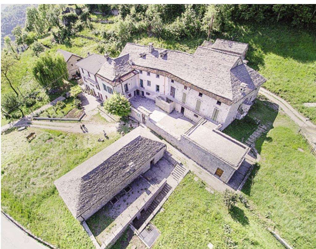
Il complesso di Cà Berizzi a Corna Imagna

Gli incontri non saranno un semplice pretesto per sedersi a tavola e degustare piatti. La proposta - sottolinea la presentazione - ha come obiettivo rafforzare il senso di appartenenza delle identità locali verso la passione per il lavoro della terra, la costruzione di prodotti agroalimentari e le storie di uomini e ambienti di ieri e di oggi. Gli incontri avranno una cadenza quindicinale presentando ogni volta una diversa realtà dell'arco alpino con la partecipazione di