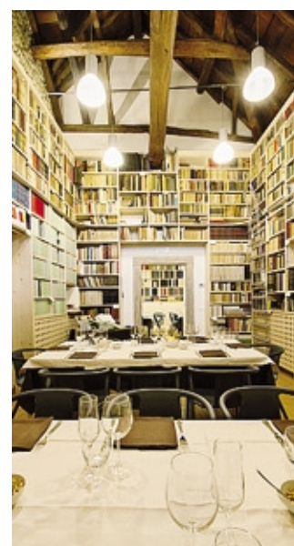
La Bibliosteria di Cà Berizzi

allevatori, agricoltori, amministratori e personaggi. Aggiunge il direttore del Centro studi Antonio Carminati: in questo modo verranno presentati i diversi contesti locali così da far conoscere antiche e nuove esperienze nel mondo della produzione e commercializzazione di prodotti artigianali di qualità provenienti dalle aree montane. Cà Berizzi non è alla prima iniziativa del genere. Lo scorso anno erano state presentate le cucine contadine e pastorali della valle del Belice in Sicilia, della Val Vibrata in Abruzzo e della montagna genovese. Ora l'attenzione viene concentrata sulla cucina e l'identità alpina, seconda tappa di un programma di un percorso che prevede altri due cicli: uno sulla Lombardia orientale nell'anno della Regione europea della gastronomia, il secondo sulle regioni italiane.