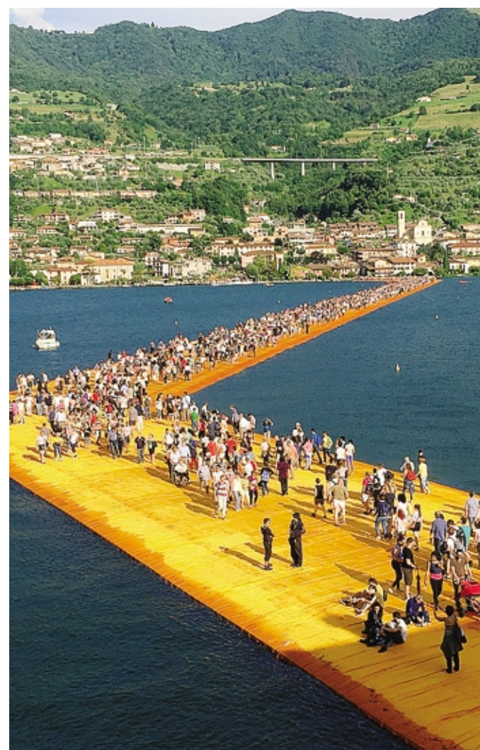
«The floating piers» è stata l'opera più visitata d'Italia nel 2016

Finanziare progetti culturali di qualità significa sostenere il turismo e il suo indotto»