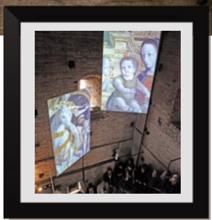
A lato il museo verticale di Treviglio

della cultura: un teatro da 200 posti, il museo verticale e due spazi polifunzionali; questo ha certamente contribuito a consolidare e aumentare l'offerta di iniziative. Fondamentale anche la collaborazione con associazioni e privati del terzo settore, per concordare la programmazione delle iniziative durante l'anno e creare una proposta strutturata. Abbiamo lavorato nonostante le difficoltà economiche che in questi anni hanno riguardato tutti i Comuni».