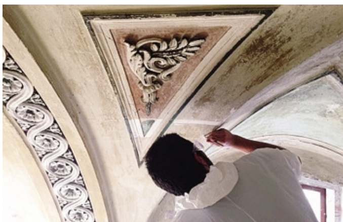
Una fase dei lavori nella chiesa del Carmine di Spirano