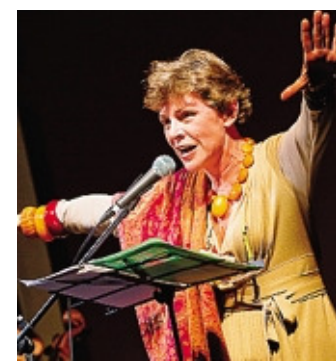
L'attrice Pamela Villoresi