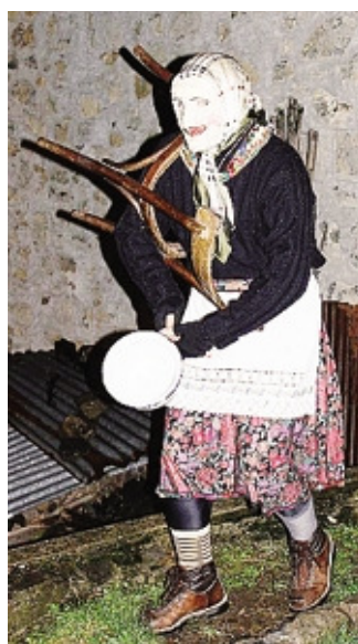
«Mascherada de Berbèn»