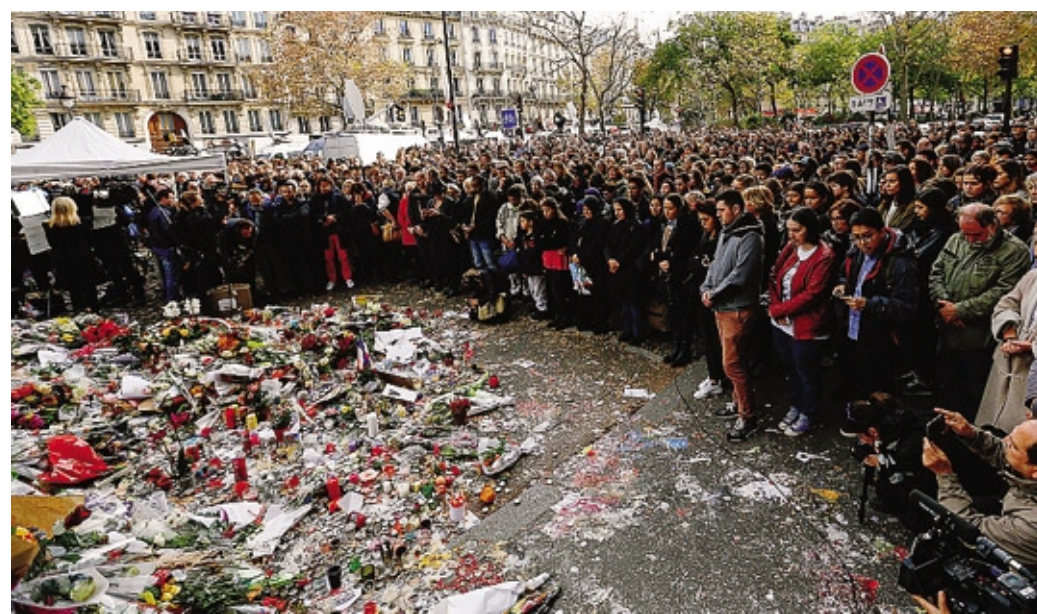
La folla in silenzio dopo l'attentato al Bataclan del 13 novembre 2015

«Mi è venuta in mente immediatamente dopo l'attentato al Bataclan del 13 novembre 2015. Ho pensato a tutti quei giovani uccisi mentre andavano a sentire della musica, ho pensato alle loro famiglie, ai fratelli, alle sorelle, a come i genitori avrebbero potuto giustificare la morte di una persona cara ai loro bambini. Ho