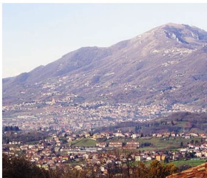
Panoramica di Almenno San Bartolomeo