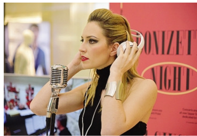
Ariadne ha cantato celebri brani del repertorio operistico

Per partecipare a un singolo concerto o abbonarsi all'intera rassegna è necessario essere in possesso di tessera Arci e prenotare via mail scrivendo a info@suono1981.com . È gradito contributo di solidarietà all'ingresso.