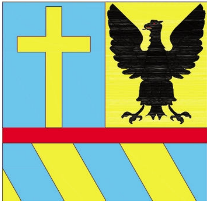
Il nuovo stemma di Val Brembilla, con croce e aquila